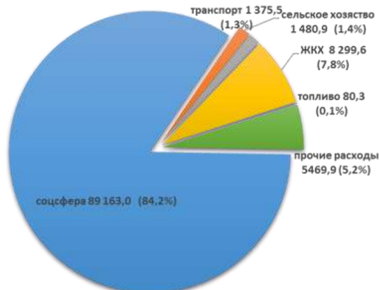
Структура расходов бюджета Светлогорского района на 2020 год

Расходы консолидированного бюджета района на 2020 год запланированы в сумме 105 869,2 тыс. рублей.