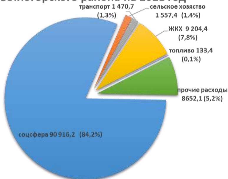
Структура расходов бюджета Светлогорского района на 2021 год

Расходы консолидированного бюджета района на 2021 год запланированы в сумме 111 934,2 тыс. рублей .