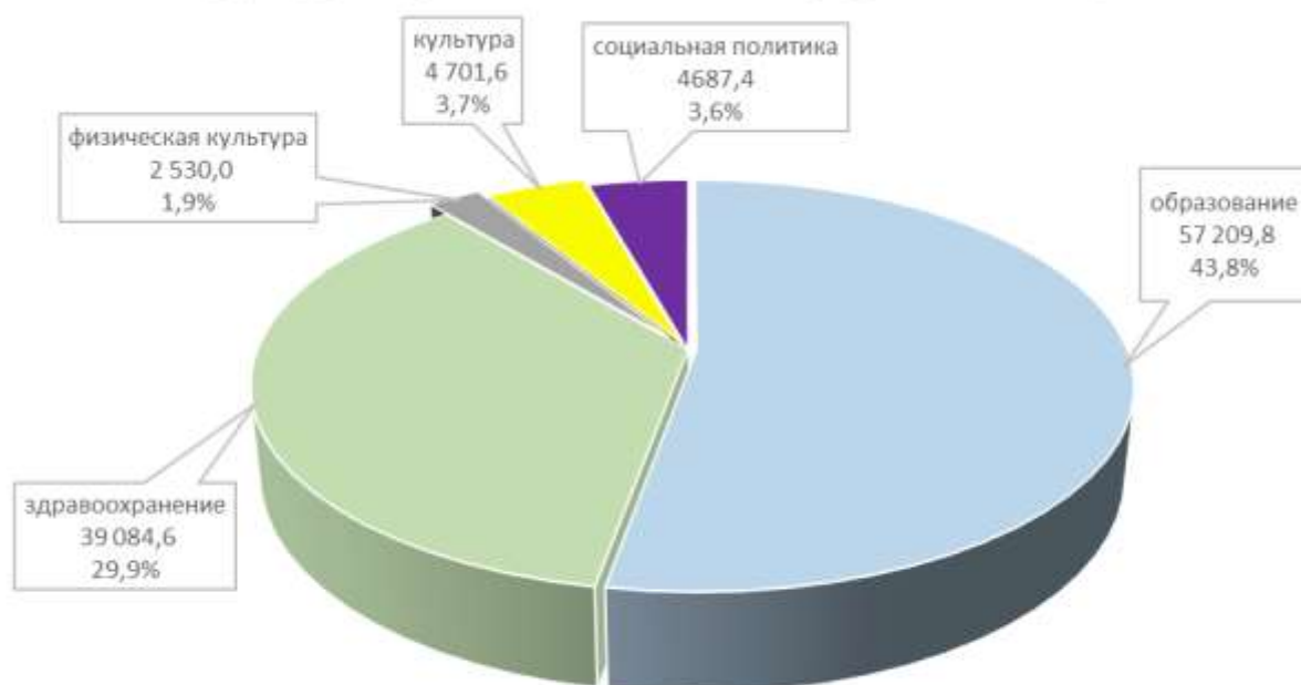
Структура отраслей социальной сферы в 2022 году

В составе расходов консолидированного бюджета доминируют расходы, связанные с финансированием обеспечения функционирования непосредственно учреждений социальной сферы и мероприятий, проводимых этой сферой. На 2022 год они запланированы в сумме 108 213,4 тыс. рублей или 82,9 % объема расходов консолидированного бюджета района.