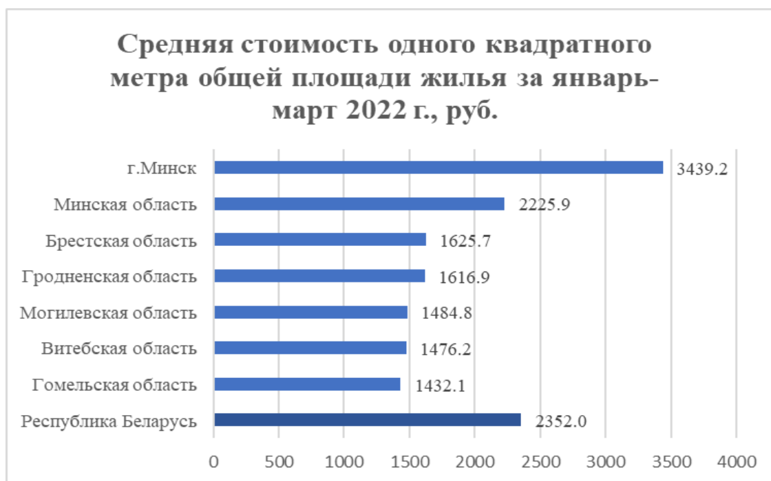
Рисунок 1 – Средняя стоимость 1 кв.м общей площади жилья (январь–март 2022 г.)