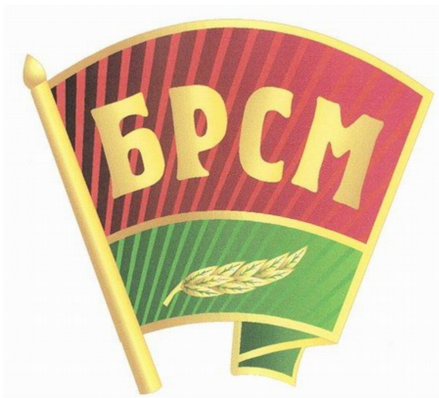
Эмблема ООО "БРСМ"