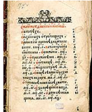
Евангелие-апракос. Начало XVI в. Рукопись (памятник книжной культуры из фондов Национальной библиотеки Беларуси)

- заповедные территории (топографически обозначенные зоны или ландшафты, созданные человеком или природой);